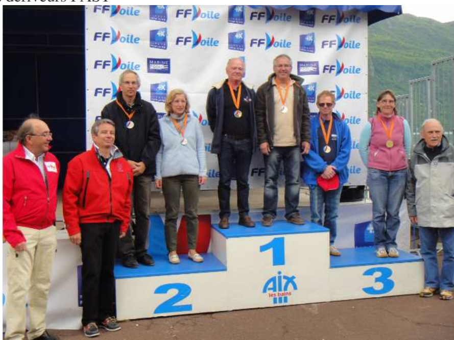
Groupe DERIVEURS FAST après 9 courses (8 retenues) (30 inscrits)

(Cliquez sur les noms soulignés pour accéder à la fiche du coureur)