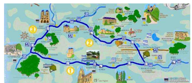
Boucle centrale de l'Aisne (315 km)