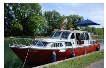
Vedette fluviale de l'association

Pour les propriétaires de bateaux à moteur, une zone de stationnement est prévue par les Voies Navigables de France sur Pommiers.