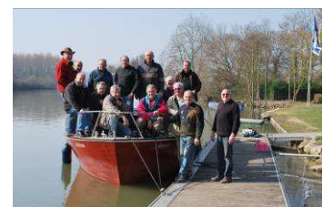
Equipe des jeunes retraités Mars 2011