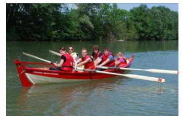
Yole de Ness à avirons