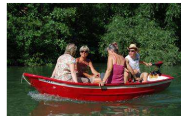
Promenade en barque à l'aviron ou avec moteur électrique

Pendant l'été, l'association loue des pédalos, des canoës et des barques avec moteur électrique.