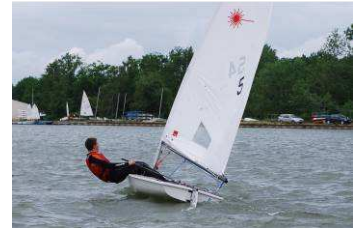
Dériveur type laser