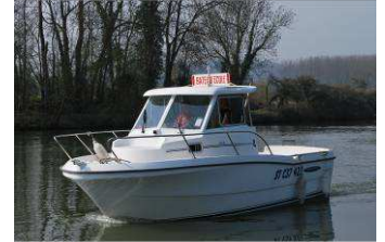
Bateau école de l'association