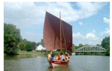
Yole de Ness à voile