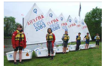
Optimists de compétition Coût en 2009 : 18000 €