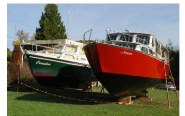
Entretien des vedettes fluviales