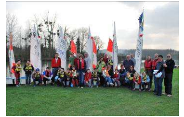
Ecole de voile mars 2011