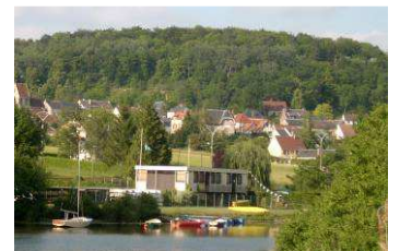
Base nautique de Pommiers