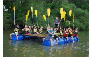
Raid en radeau

En partenariat avec la ville de Soissons, nous participons aux actions "passeport jeune" et "à fond l'été".